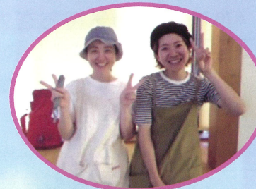
エリちゃん、ケイちゃん、