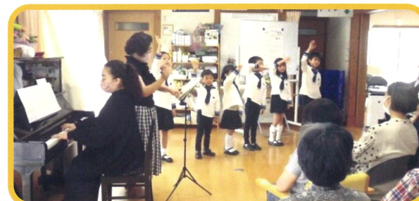
「常滑こども合唱団」