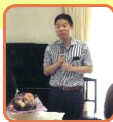
常滑市長 伊藤辰矢 様