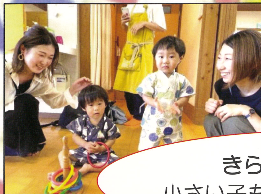
きらり倶楽部の縁日 小さい子も一緒に楽しめました