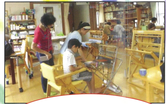
さをり体験 機織りって面白い♪