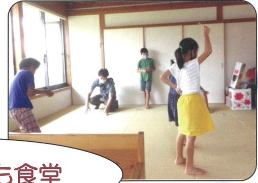
みんなでお昼ご飯を食べ、きらり倶楽部の利用者さんと一緒に遊びました。