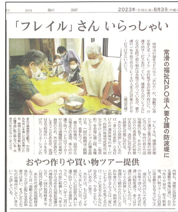
2023.8.3 中日新聞 知多版