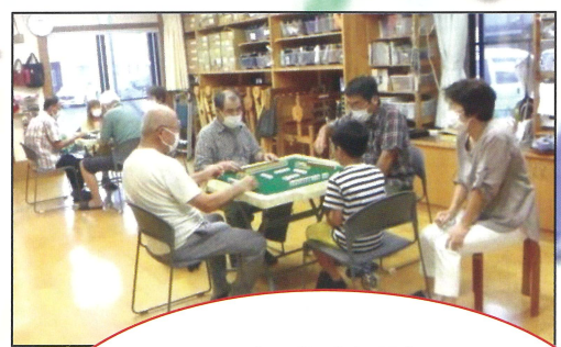
麻雀体験 子どもも負けずに・・・ 「ロン！」