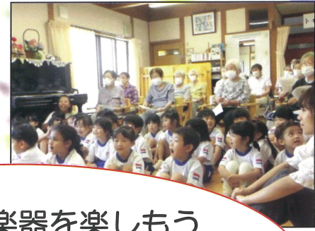
世界の民族楽器を楽しもう 初めて見る楽器の演奏やお話を熱心に聴いていました。