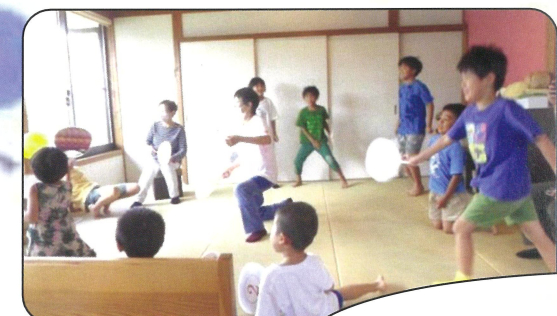
夏休み子ども食堂