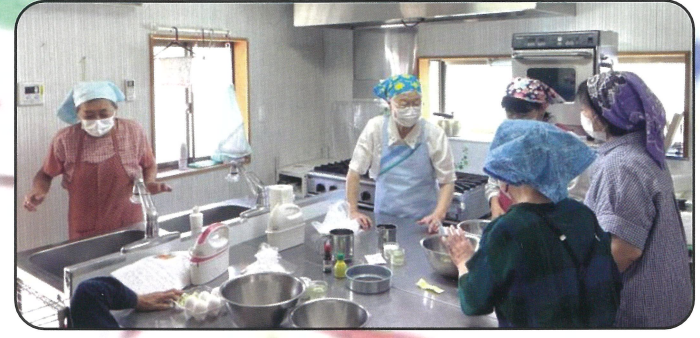
レモンシフォンを作ろう