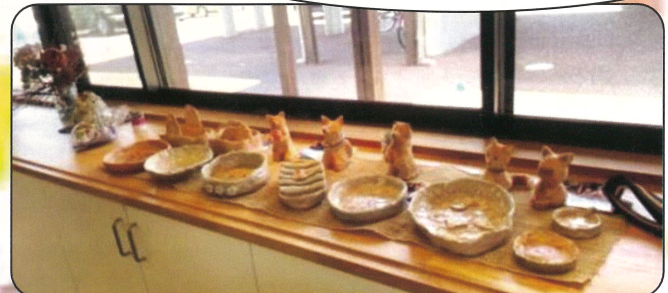
大人も子どもも、思い思いに粘土をこねて世界に一つだけの作品を作りました。笑顔も作品もステキです♡