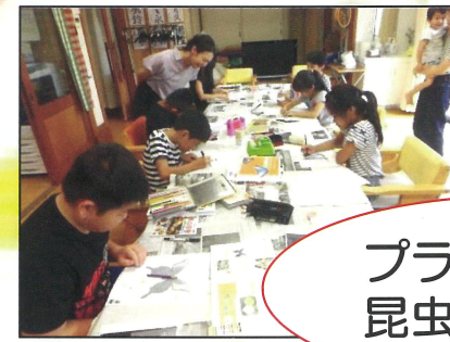
プラ板で立体昆虫を作ろう